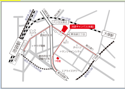
豊島区東池袋2-51-4 (JR池袋駅東口 徒歩12分)